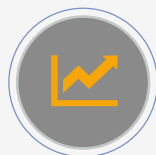
Wykres mocy grzewczej