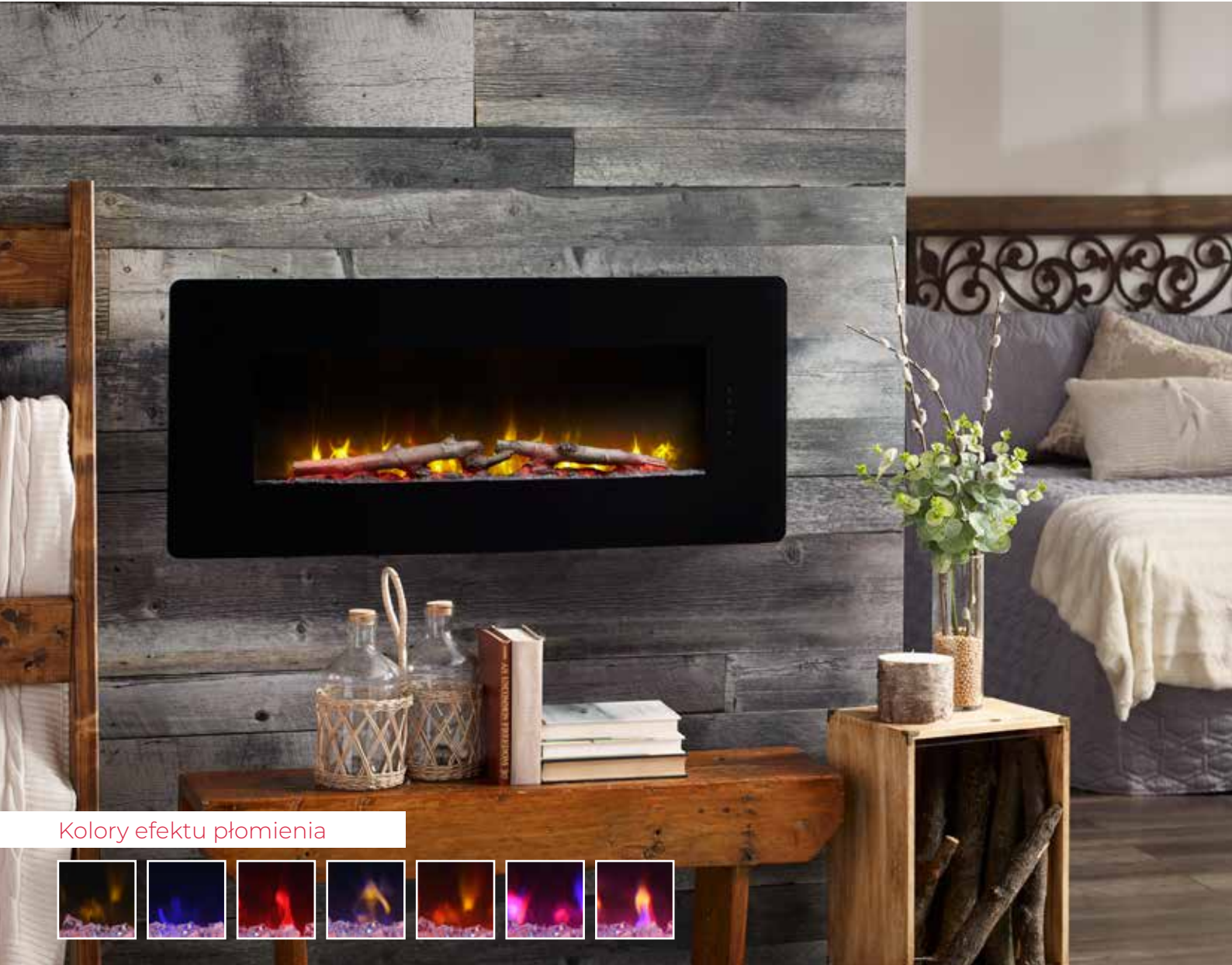
Kolory efektu płomienia