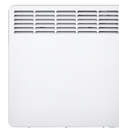
CWM 750 P