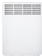
CWM 500 P