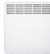
CWM 1000 P